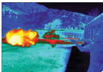
Prueba de municiones